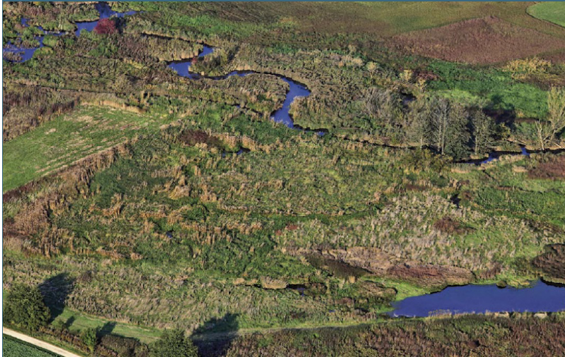
Abb. 6: Vom Biber gestaltete Landschaften sind ausgesprochen vielfäl- tig und artenreich.