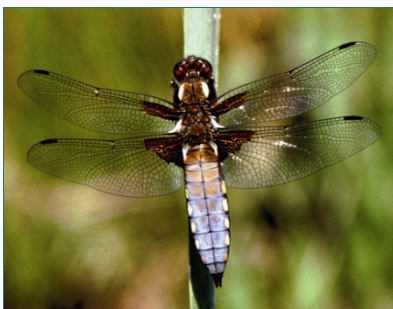
Abb. 7: Plattbauch-Libelle

Vom Menschen geschaffene oder umgestaltete Gewässer kennt die heimische Tier- und Pflanzenwelt dagegen erst seit wenigen hundert Jahren. Deshalb profitieren zahlreiche vom Aussterben bedrohte oder gefährdete Vögel, Amphibien und Libellen von der Wiedereinbürgerung des Bibers. Dies ist ganz im Sinne der Bayerischen Biodiversitäts-Strategie: Dort heißt es unter dem Stichwort „Handlungsschwerpunkte für die Zukunft“: „Fließgewässer sowie Seen und Weiher einschließlich der Ufer- und Verlandungszonen sollen dauerhaft eine naturraumtypische Vielfalt aufweisen und ihre Funktion als Lebensraum erfüllen.“