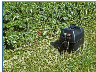
Abb. 17: Elektrozäune halten die lernfähigen Biber fern.