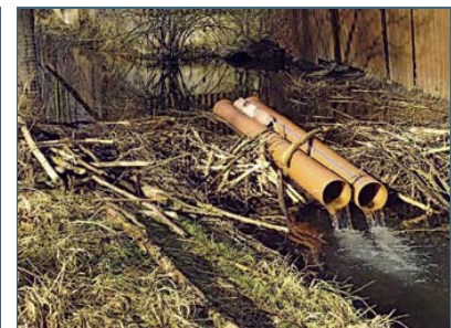
Abb. 18: Rohre im Biberdamm senken den Wasserspiegel.