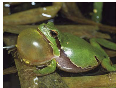
Abb. 12: Laubfrosch