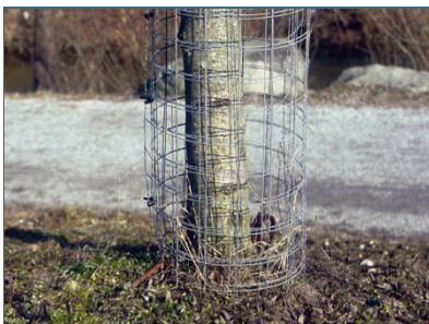
Abb. 16: Maschendraht schützt Bäume wirksam vor Verbiss.