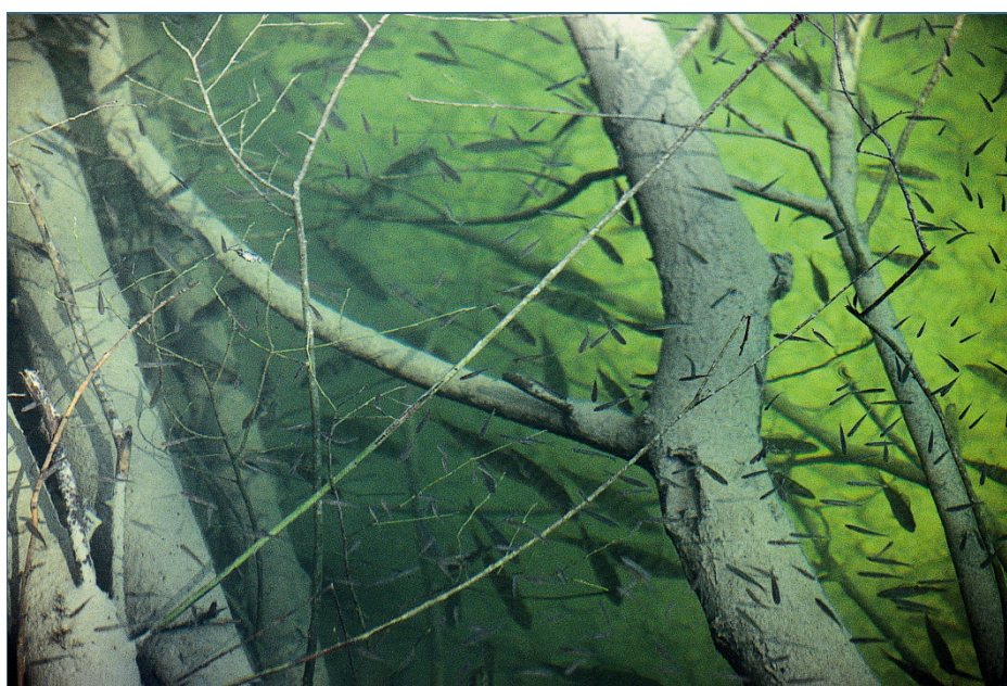
Abb. 5: Das vom Biber erzeugte Totholz schafft Jungfischen einen sicheren Unterstand.

Fällt ein Biber den Baum so, dass er ins Wasser stürzt, bietet das untergetauchte Geäst den Fischen gute Verstecke. Eine ähnliche Wirkung haben die Burgen, Dämme und Nahrungsflöße des Bibers. Im direkten Umfeld einer Biberburg findet man nach Untersuchungen des Landesfischereiverbandes Bayern Fischdichten, die bis zu 80-mal so hoch sind wie an vergleichbaren Gewässern ohne Biber. Der Grund: In Biberteichen finden Fische besonders viel Nahrung, sie vermehren sich gut und werden besonders groß; die Zahl der Laichplätze, Jungfisch-Einstände oder Winter-Ruheplätze steigt.