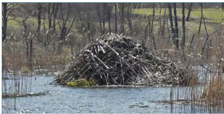
Abb. 4: Freistehende Burgen können über drei Meter hoch werden, ihr Eingang liegt stets unter Wasser.