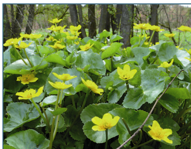
Abb. 11: Sumpfdotterblume