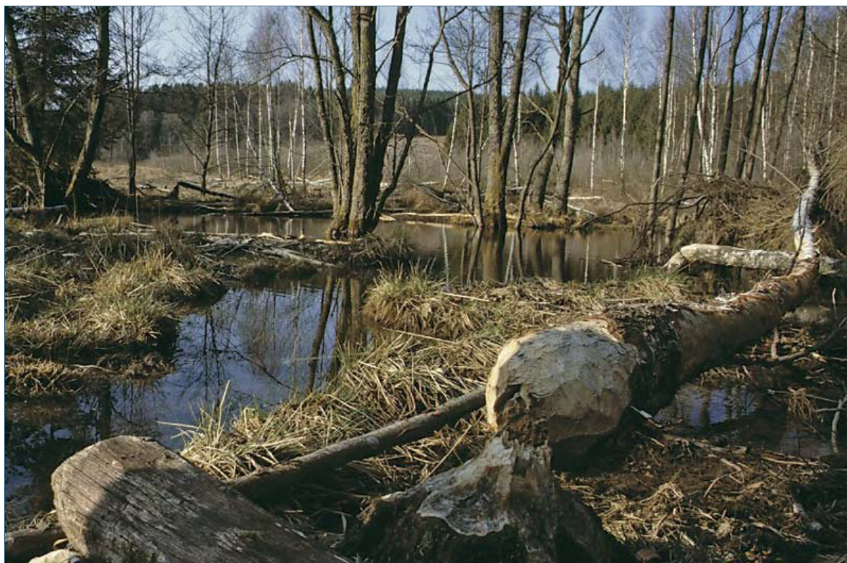
Abb. 13: Einst waren Biber in fast ganz Europa zuhause und haben die Landschaft geprägt. Heute, über 40 Jahre nach der Wiedereinbürgerung, besiedeln sie immer mehr Gewässer und verwandeln sie in ungewohnte Wildnis. Biber sowie ihre Baue und Dämme stehen unter strengem Naturschutz.

Nach dem Bundesnaturschutzgesetz ist der Biber streng geschützt. Das bedeutet, es ist verboten, ihm nachzustellen, ihn zu fangen, zu verletzen oder zu töten. Genauso ist es verboten, den Biber zu stören, seine Baue und Dämme zu beschädigen oder zu zerstören. Biber dürfen nicht verkauft oder gekauft werden, weder lebend noch tot oder ausgestopft.