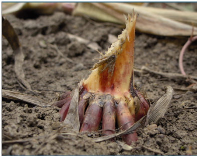
Abb. 14: Biber fressen auch Nutzpflanzen, z. B. Maisstängel.

Beratung und Öffentlichkeitsarbeit sind die Basis, um Konflikte mit dem Biber zu entschärfen oder zu lösen. Denn viele Konflikte mit Bibern entstehen oder verschärfen sich allein aus Unkenntnis über die Tiere und ihre Lebensweise: den Betroffenen sind viele der – oft erstaunlich einfachen – Möglichkeiten, einen Konflikt mit dem Biber zu beseitigen, nicht bekannt. Dabei reicht manchmal ein wenig Maschendraht. Bei Vorträgen und Exkursionen vermitteln die Biberfachleute wichtiges Wissen. Wer als Gartenbesitzer weiß, dass er seine Bäume ohne großen Aufwand schützen kann, steht dem Biber entspannter und positiver gegenüber.