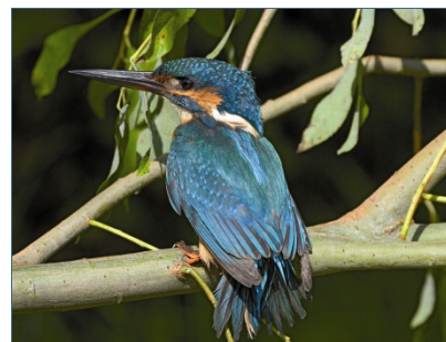
Abb. 9: Eisvogel