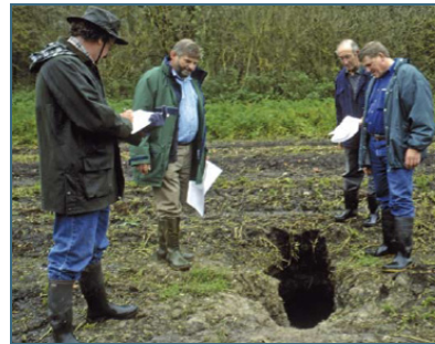
Abb. 15: Die meisten Konflikte mit Bibern lassen sich lösen.