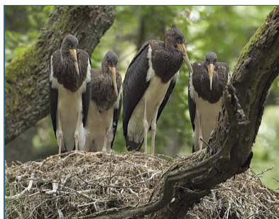
Abb. 8: Schwarzstörche