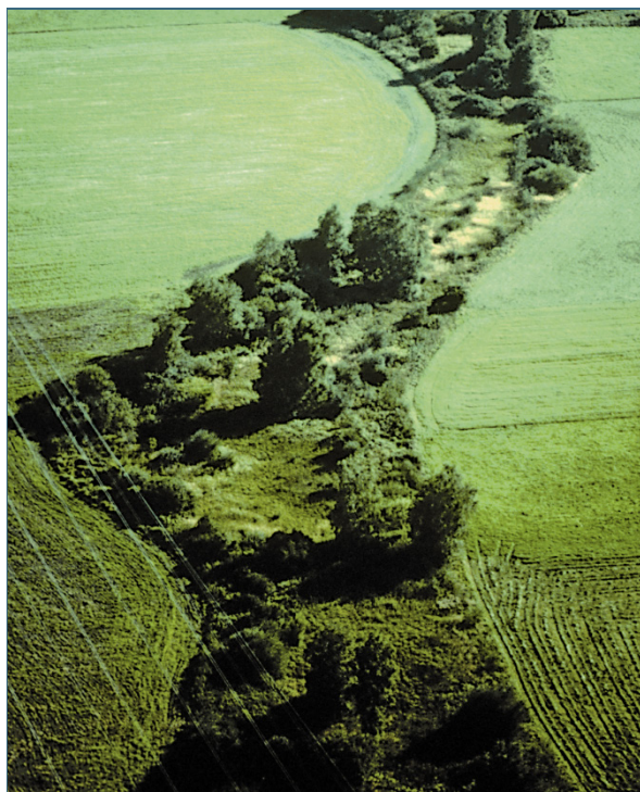
Abb. 19: Uferrandstreifen schaffen Abstand zwischen Biberrevier und Acker.

Eine wirksame und langfristig kostengünstige Maßnahme, um Probleme mit Bibern zu verringern, besteht darin, den Tieren ausreichend Lebensraum zu überlassen: In größeren Gewässern mit naturnahem Bewuchs fallen Biber kaum auf. Nimmt man Uferrandstreifen aus der Nutzung, bleibt den Bibern – und dem Gewässer – mehr Raum zur natürlichen Entwicklung.