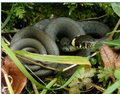
Abb. 10: Ringelnatter