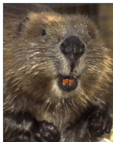
Abb. 2: Biber sind Nagetiere. Sie können über 30 kg schwer werden.