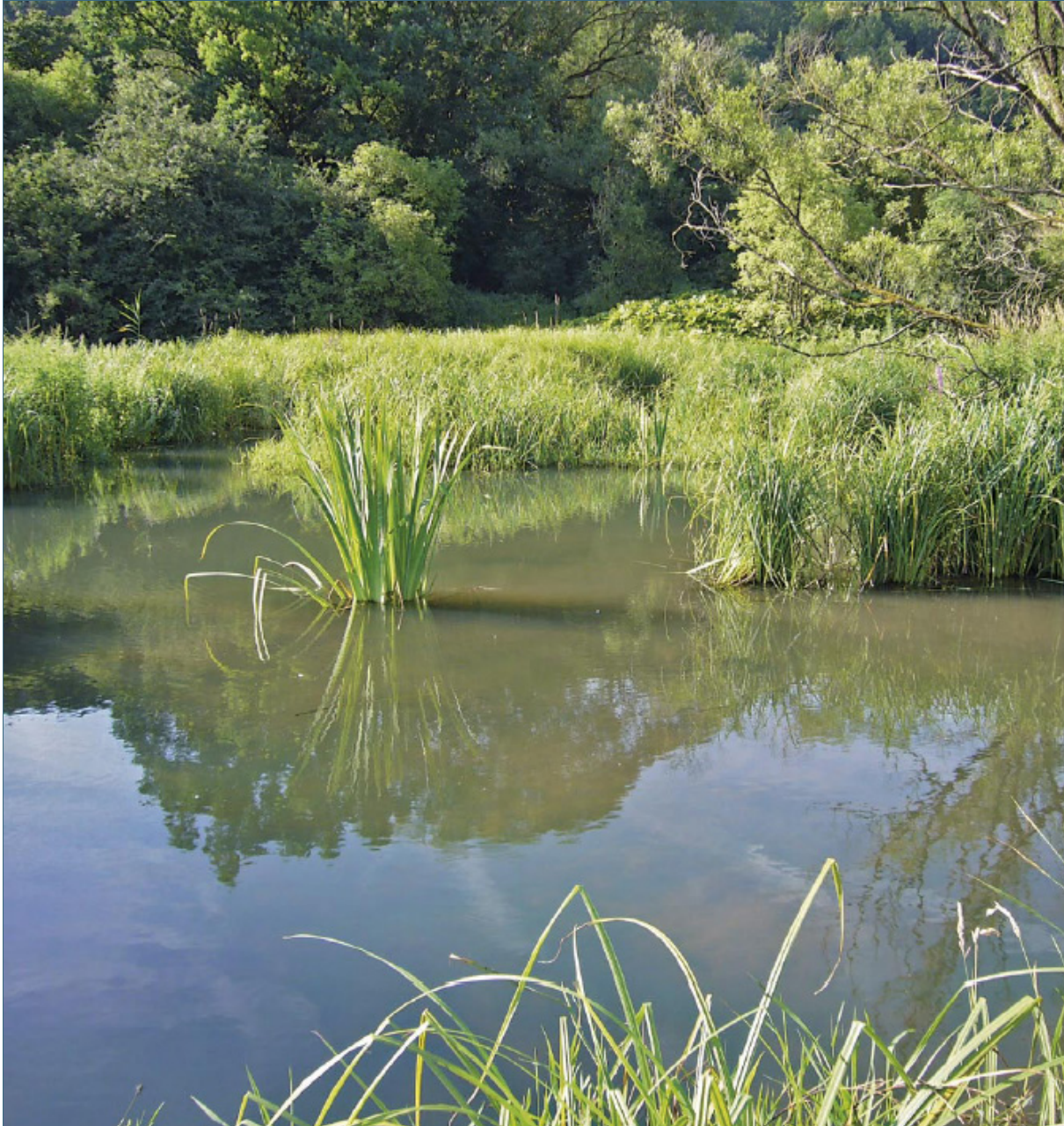
Abb. 20: Der Biber arbeitet für den Naturschutz, reguliert den Wasserhaushalt und schafft erholsame Landschaften für uns Menschen.

Biber haben sich vielerorts zu einem Qualitätsmerkmal für Erholungslandschaften entwickelt – sie locken sogar Urlauber an. In allen Teilen Europas sind in den vergangenen Jahren Biberlehrpfade angelegt worden. Exkursionen zu Biberrevieren sind sehr beliebt, die Teilnehmerzahlen zeugen vom großen Interesse an der Art. Bibertouren und -führungen können so zu einer neuen Einnahmequelle für den ländlichen Raum werden.