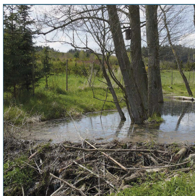
Abb. 3: Mit ihren Dämmen passen Biber den Wasserstand an ihre Bedürfnisse an.

Da Biber ihren Lebensraum aktiv gestalten, sind sie bei der Wahl eines Gewässers sehr flexibel. So besiedeln sie große Fließgewässer und Seen ebenso wie kleine Teiche, Bäche und Gräben. Aus kleinen Bächen lassen sie mitunter ganze Ketten von Biberseen entstehen.